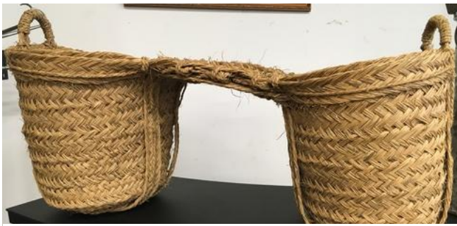
Figura 3 - Mangiatoia doppia portatile per dorso d'asino.

Il Tempo di Natale incomincia con la solenne Vigilia del Natale che ci prepara a [ri]vivere la notte luminosissima nella quale Dio ci ha donato il Figlio unigenito per la nostra salvezza. Tutto è chiaro fin dal principio, come ci racconta in particolare Luca: Dio nasce per noi in un luogo inospitale (soprattutto per un neonato), potremmo dire “per strada” e infatti viene posto – secondo il racconto di Matteo – in una mangiatoia portatile, φάτνη ( fáten ), sul dorso di un asino 42 . Come narra