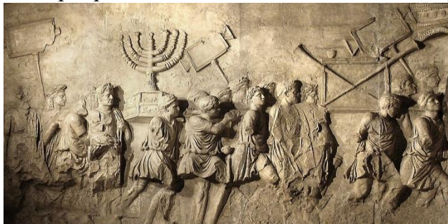
Figura 2 - Bassorilievo che illustra il sacco di Gerusalemme del 70 d.C. Arco di Tito, Roma.

«Il cristianesimo ha [...] voluto innestarsi sul tronco vivo del giudaismo facendo proprie le sue attese più profonde» 29 . A fondamento della sua opera, l'evangelista pone il compimento per mezzo