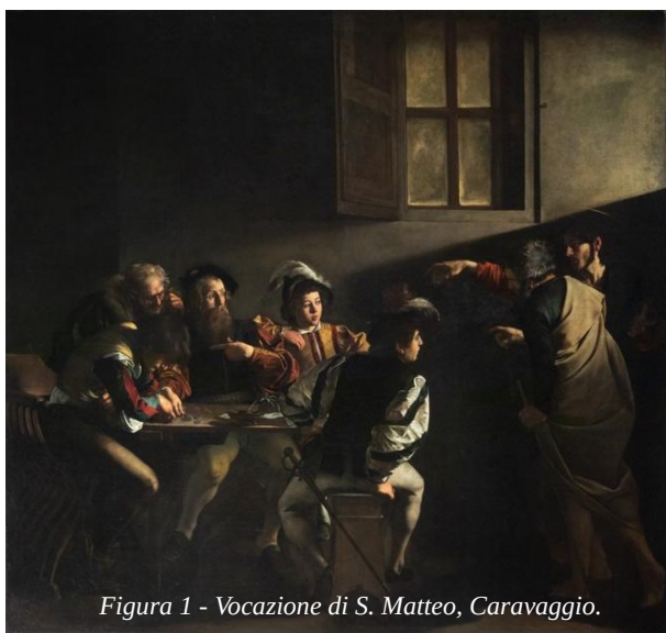
Figura 1 - Vocazione di S. Matteo, Caravaggio.

L'autore di questo vangelo non è Levi l'apostolo, uno dei discepoli più intimi di Gesù, l'ex-pubblicano 6 . Questo scriba «si muove in ambiente ebraico e il suo scritto ha per destinatari immediati, i credenti provenienti dall'ebraismo» 7 .