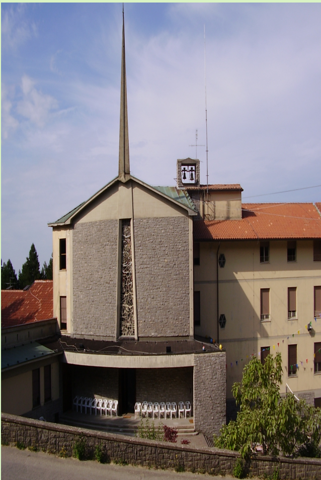
Chiesa del Villaggio Sacro Cuore